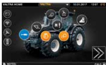
Meniu lengva naršyti.

"Valtra SmartTouch" ženkliai pagerino traktoriaus valdymą. Jis intuityvesnis net už Jūsų išmanųjį telefoną. Nustatymai yra lengvai pasiekiami dviem bakstelėjimais ar perbraukimais ekrane, o visos technologijos yra integruotos į naujus, lengvai valdomus sistemų formatus: lygiagreto vairavimo, ISOBUS, telemetrijos, AgControl ir užduočių valdymo TaskDoc.