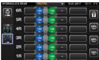
Bet kuriuo valdikliu galite valdyti bet kurią hidraulinę funkciją, įskaitant hidraulinius vožtuvus (priekinius ir galinius), keltuvus (priekinį ir galinį) ar frontalinį krautuvą.