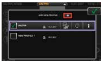
Operatoriams ir padargams skirti profiliai lengvai pakeičiami bet kurio ekrano meniu. Visi nuostatų pakeitimai įrašomi į pasirinktą profilį.