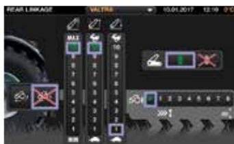
Parametų nustatymas ekrane lengvai suprantamais, dideliais valdikliais.