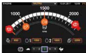
Greitas parametų keitimas palietimu. Visi nustatymai yra automatiškai išsaugomi atmintyje.