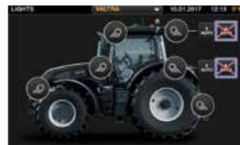
Terminale lengva konfigūruoti darbinis žibintus. Darbinių žibintų įjungimo / išjungimo jungikliai ir švyturėlių įjungimo / išjungimo jungikliai yra porankyje.